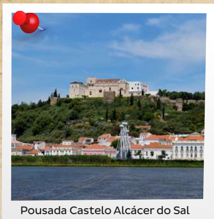
Pousada Castelo Alcácer do Sal