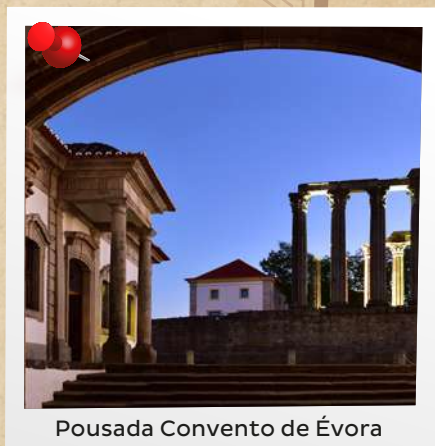
Pousada Convento de Évora