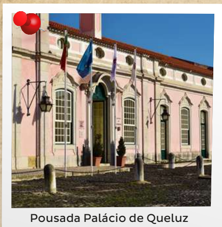
Pousada Palácio de Queluz