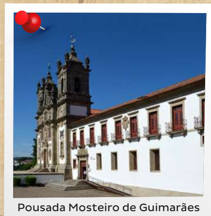
Pousada Mosteiro de Guimarães