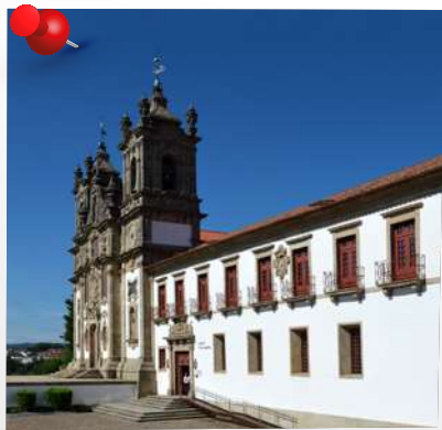
Pousada Mosteiro de Guimarães